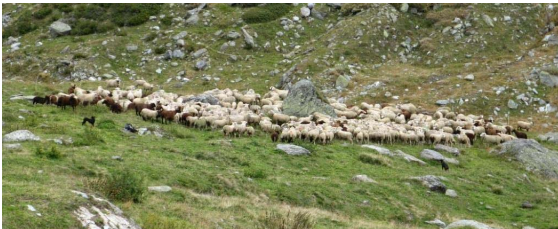
Manchmal mussten wir die ganze Bande alleine zusammenhalten