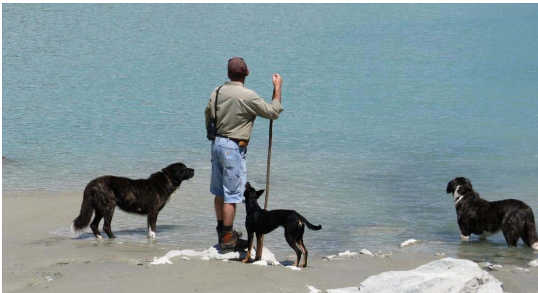
Was ist jetzt – gehen wir ans Meer oder in die Berge?