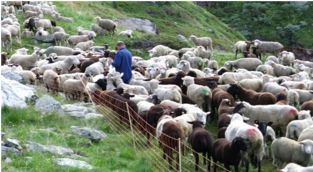
kurzum: ein bunter Haufen