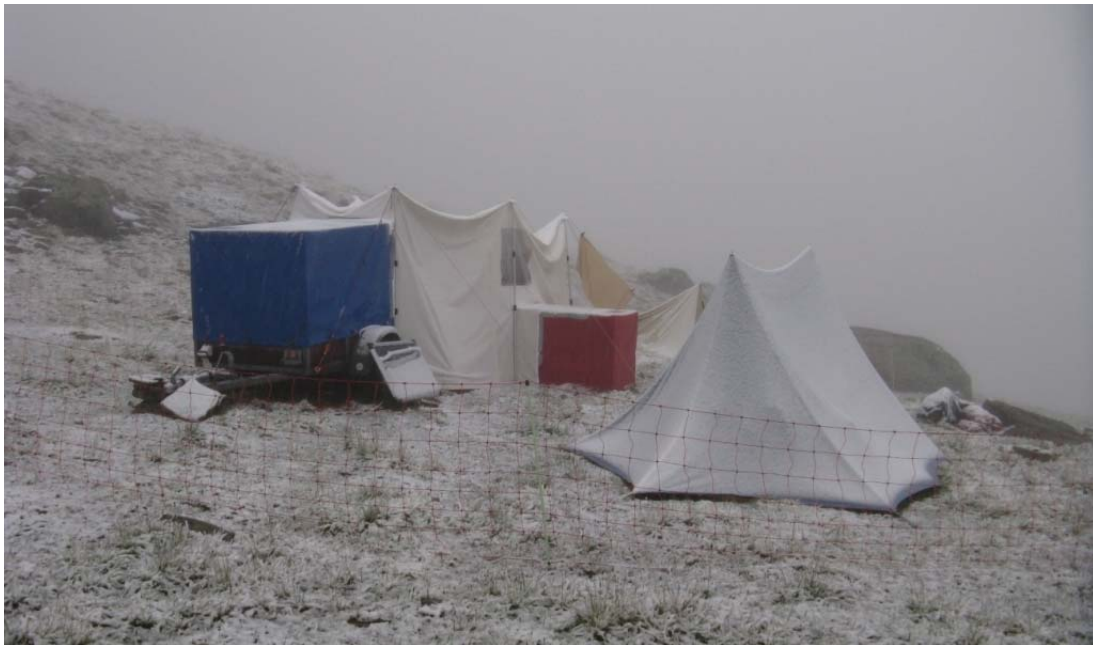
es war nicht immer nur Sonnenschein