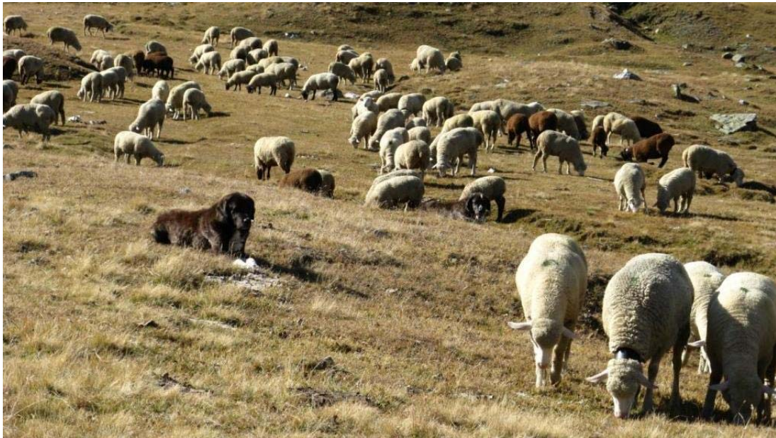
Afghanische Steppe oder nur afghanische Hirtenhunde?