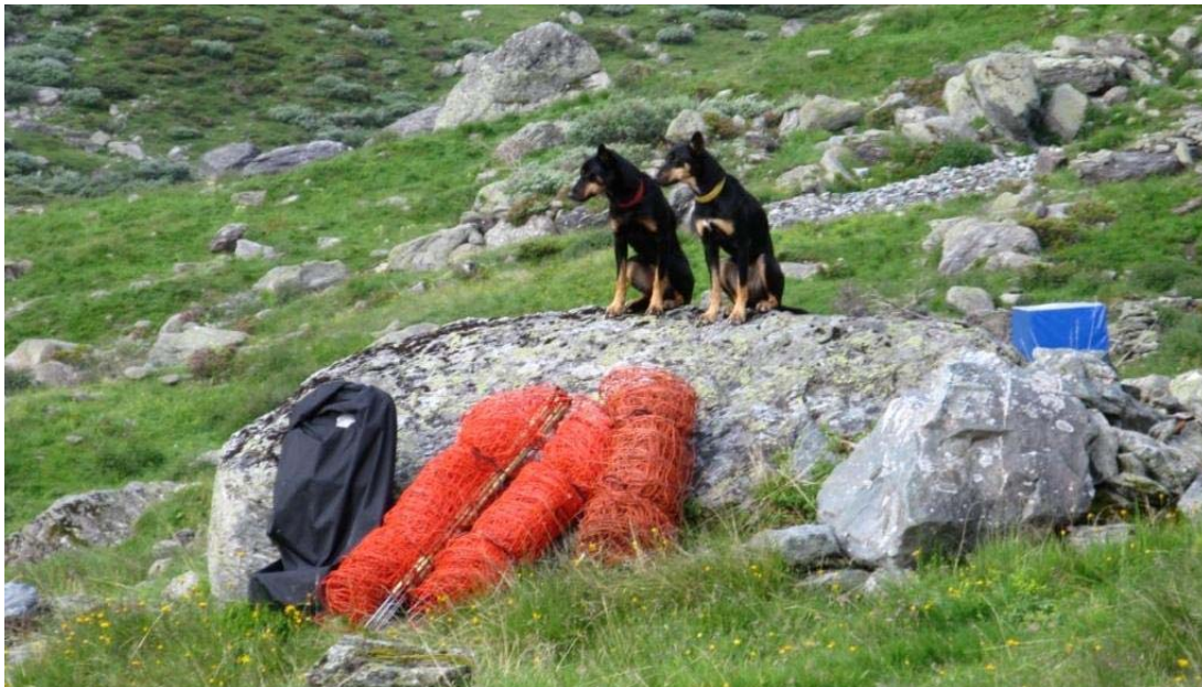
Nur um es klarzustellen: wir haben nicht nur Weidnetze gehütet!