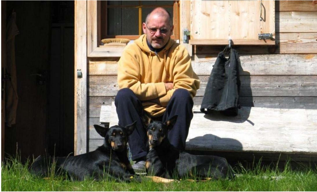
das Trio wartet auf Arbeit