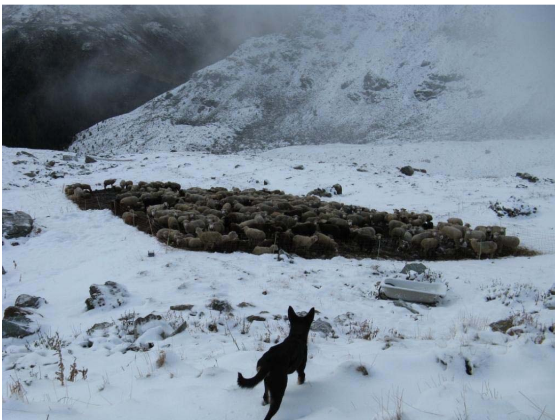
Bei jedem Sauwetter hiess es: Raus an die Arbeit