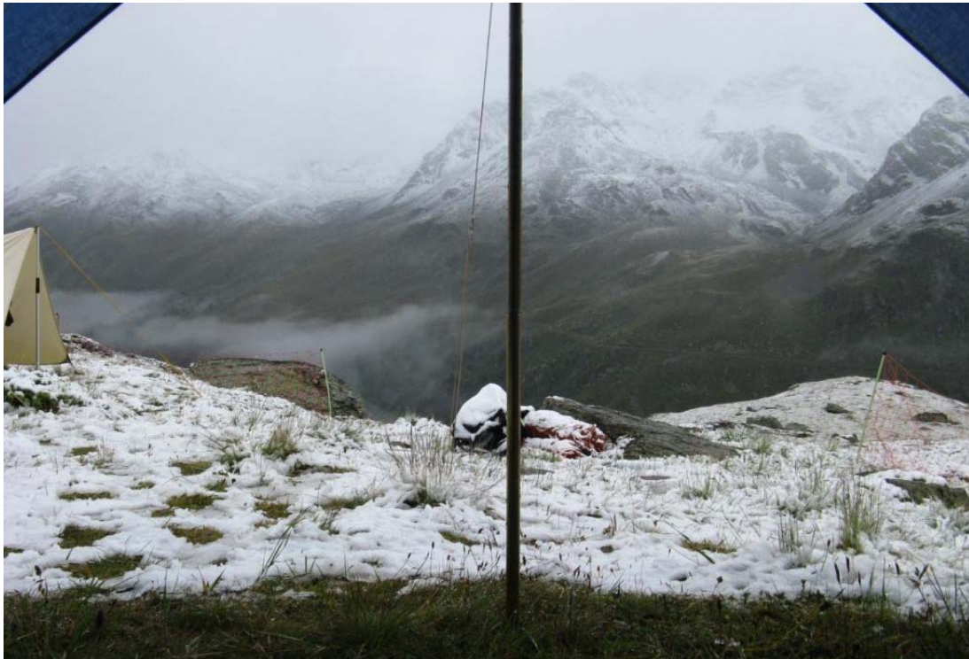
dafür gab es wunderbare Aussichten aus dem WC-Zelt