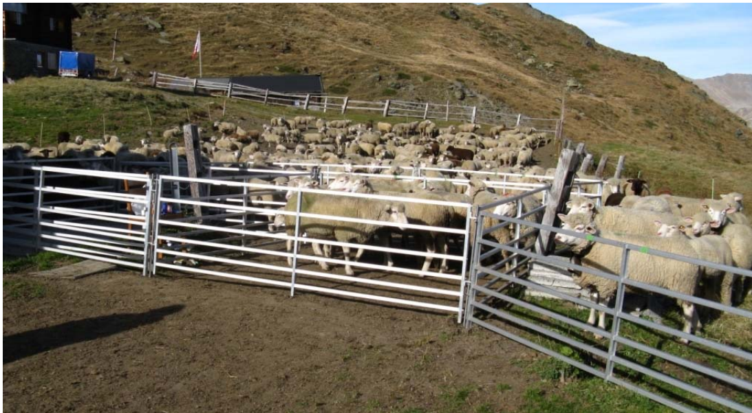
16:42 Ende der grossen Behandlung

Was ich unter anderem so alles behandelt habe: