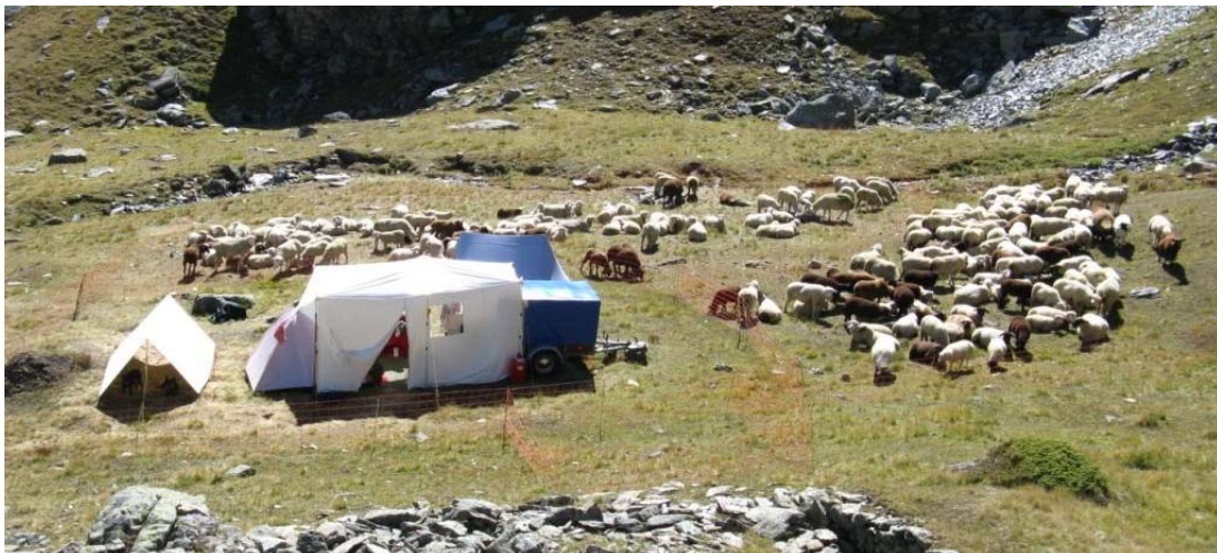
und natürlich wurde das Camp auch von den Schafen besucht