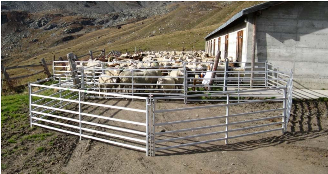
10:08 Alle bereit zur grossen Behandlung