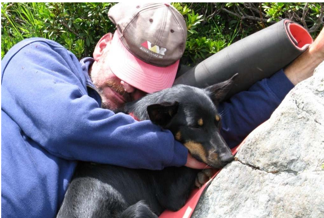
so viel Arbeit macht müde