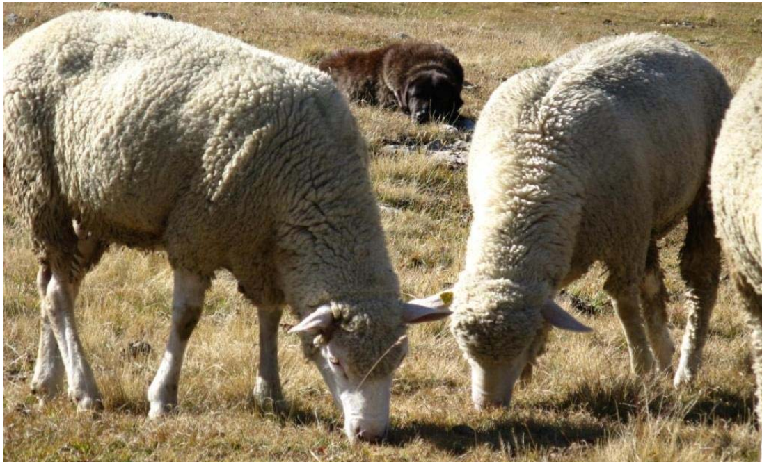
Schafidylle mit Hund